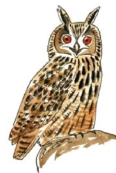
Grand Duc (envergure : 155 à 190 cm)