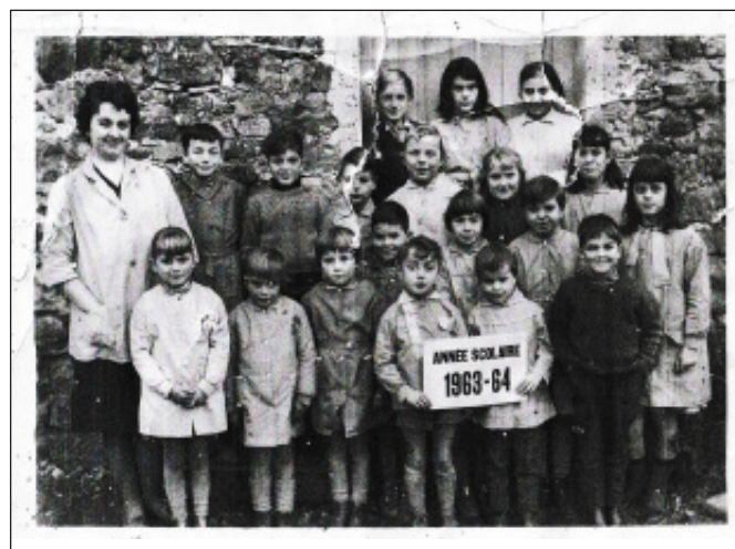
École de Luziers, 1963